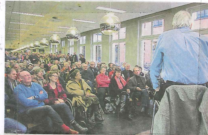
Uitpuilende zaal luistert ademloos.